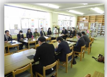
分科会に分かれての話し合い