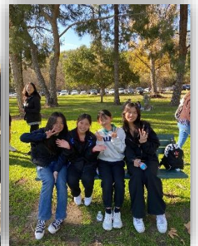
ホームステイ先の家族と