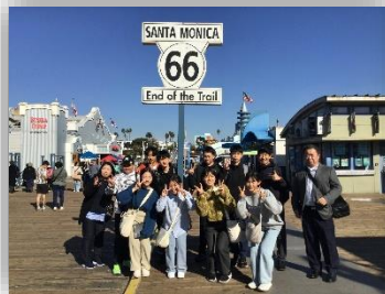
無事到着しサンタモニカへ

10日間にわたるブレア市訪問では、歓迎会や市内見学、ピクニックなど充実した日々を過ごすことができました。特に、ホームステイ先の家族とは仲良くなり、別れがさみしくなるほど濃厚な時間を過ごせました。2月にはブレア市から飯能市へ訪問があります。