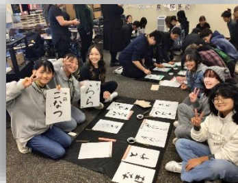
習字の授業にも参加