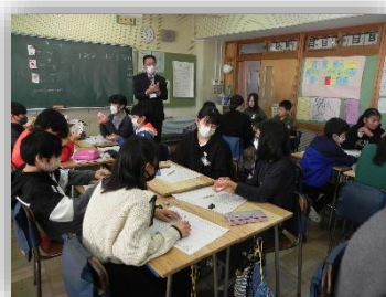
6年生へ出前授業(数学)

年に2回行っている小中連絡会を美杉台小学校で実施しました。午前中は、美杉台中の数学の3人の教員が小学6年生に出前授業を行いました。トランプを使った授業はとても楽しそうで、中学校へ入学するのが待ち遠しいのではないのでしょうか。午後は、授業参観と分科会で小中の交流を深め、連携を図っています。