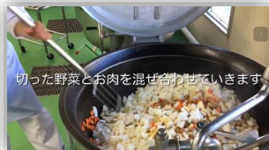
調理をしている様子

毎日おいしい給食を作っていただいている栄養士さんと調理員さんに、日頃のお礼と感謝の気持ちを込めて、感謝の手紙とプレゼントを渡しました。また、調理員さんたちが安心・安全でおいしい給食を作っている様子が紹介され、野菜などを手作業で切っている映像からも調理の丁寧さが伺えました。