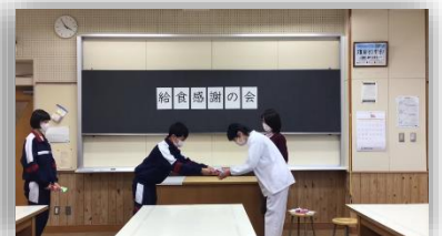
感謝の手紙とプレゼントを贈呈